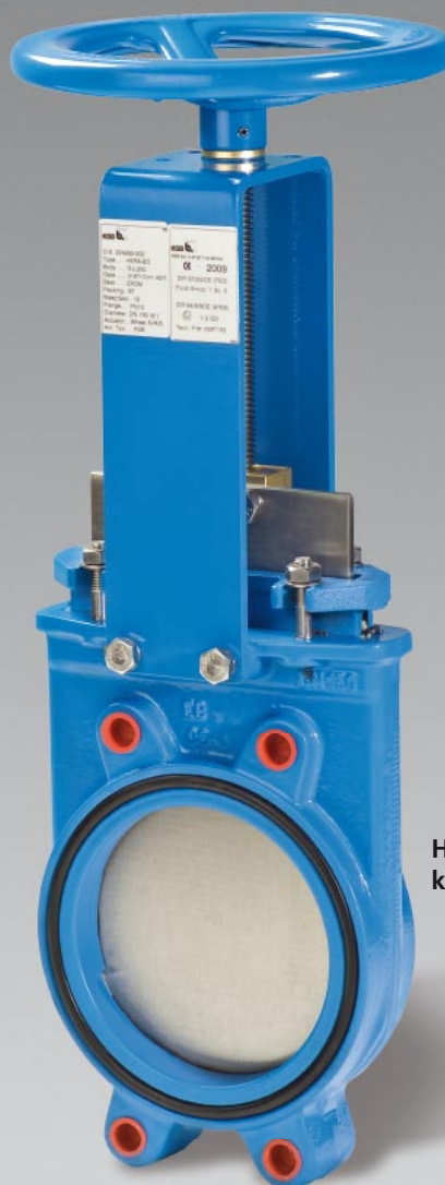
Hera® BD kézikeréssel