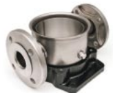
Kerek karima Movitec VSF