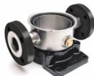
Kerek karima Movitec VF