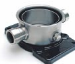
Victaulic- kapcsoló Movitec V(S)V