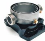
Külső menetes csatlakozás Movitec VE