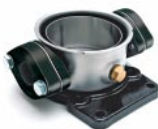
Ovális karima Movitec V