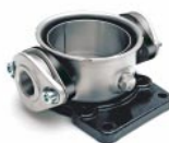
Ovális karima Movitec VS